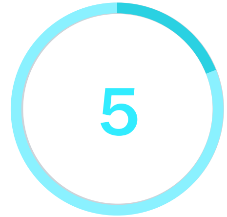
График платежей на 5 месяцев